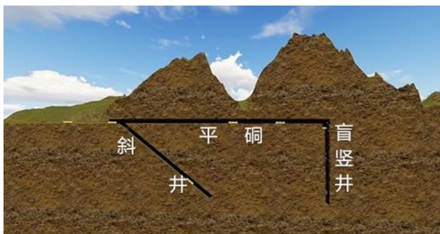
图 2：萤石采矿开拓系统示意图

公司根据产能和效益、短期与长期兼顾的原则，确定年度生产计划，并下达给各子公司。各子公司根据“开拓、采准、备采”三级矿量平衡的原则，组织生产。公司与各子公司签订责任书，明确产量和质量要求，按月考核，实施奖惩，确保目标责任的落实。